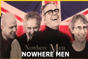
Nowhere Men NOWHERE MEN