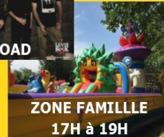
ZONE FAMILLE 17H à 19H