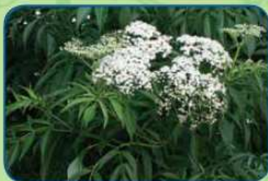
Sureau du Canada