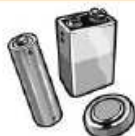
Piles et batteries rechargeables ou à usage unique, piles de cellulaire

Service offert aux citoyens de la MRC de Lotbinière et des municipalités de Deschaillons-sur-St-Laurent, Fortierville, Parisville et Sainte- Françoise seulement.