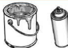
Peinture et teinture résidentielle, vernis, laque, aérosol, solvant