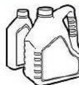
Contenants fermés d'huile à moteur et végétale